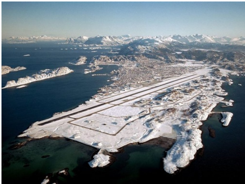
Figur 1: Den nåværende flyplassen sett fra sørvest.

Det planlegges å flytte Bodø lufthavn en snau kilometer sørover. MET har fått i oppdrag å vurdere om den værmessige tilgjengeligheten endres ved et slikt tiltak. Figur 1 viser den nåværende lufthavnen sett fra sørvest. Foreslått plassering for den nye er vist i figur 2.