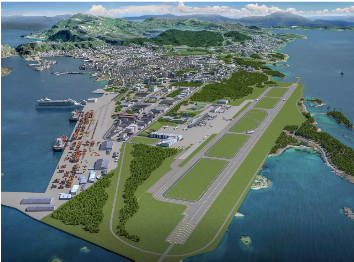
Arkitekttegning av den nye flyplassen.