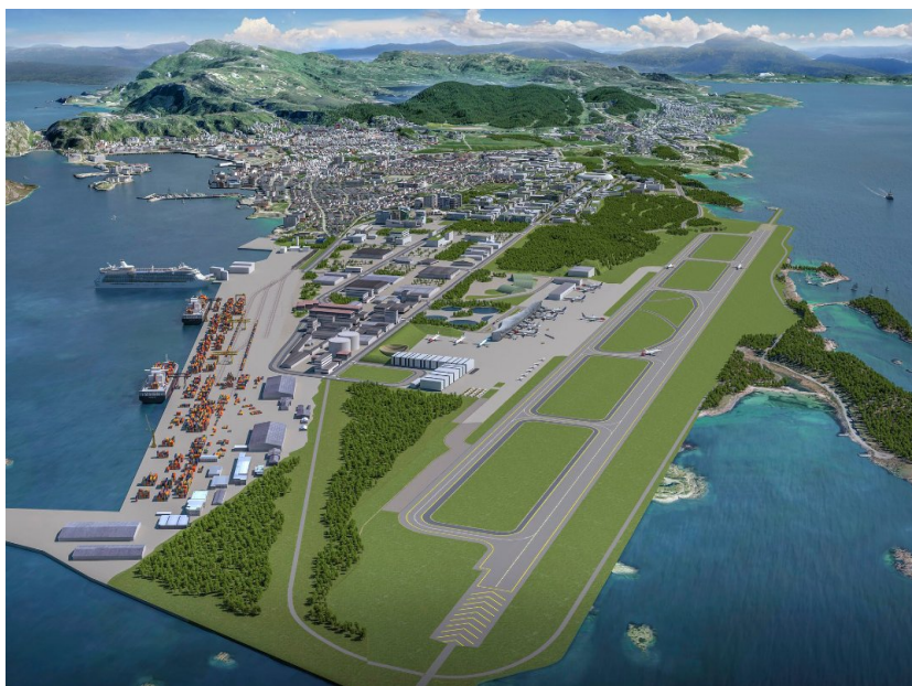
Figur 2: Slik tenker man seg den nye flyplassen.